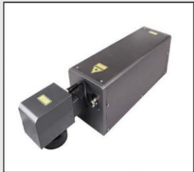
Ajuste optico puede ajustarse en 360 grados