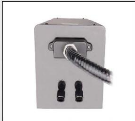
Conector de precision separable