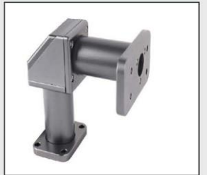
Modulo de doble eje puede ser ajustado 360 grados