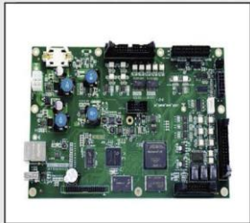
Desarrollo independiente Placa base Alta tecnologia de fabricacion