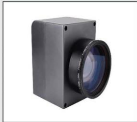
Galvanometro de barrido 2d de alta velocidad